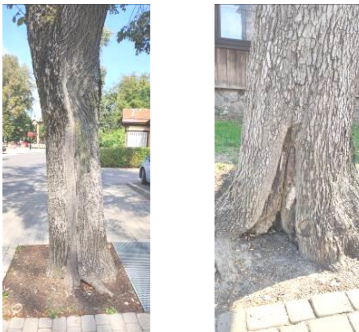
12 pav. Trakų m. Vytauto g. želdinių kamieno pažeidimai

Vytauto g. želdiniuose daug drevėtų medžių (liepos, uosiai, klevai) su išplitusiais medieną ardančiais grybais. Stipriai medienos puvinio pažeistos drevės ir susiformavusios ertmės susilpnina medžio kamieną, kuris sudėtingesnėmis oro sąlygomis gali neatlaikyti lajos svorio ir lengviau lūžti.