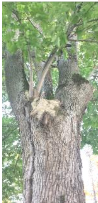
10 pav. Medienos puvinius sukeliančių grybų pakenkimai – uosis Vytauto g. Trakuose ir klevas Klevų al. Lentvaryje

Trakų m. Liepų alėjoje augančių medžių būklė yra vidutinė arba bloga. Beveik pusei liepų stebėti kamieno pakenkimai (11 pav.). Kamieno žaizdos nustatytos 47% liepų, medienos puviniai – 45% liepų, vidutiniškai gausu drevių.