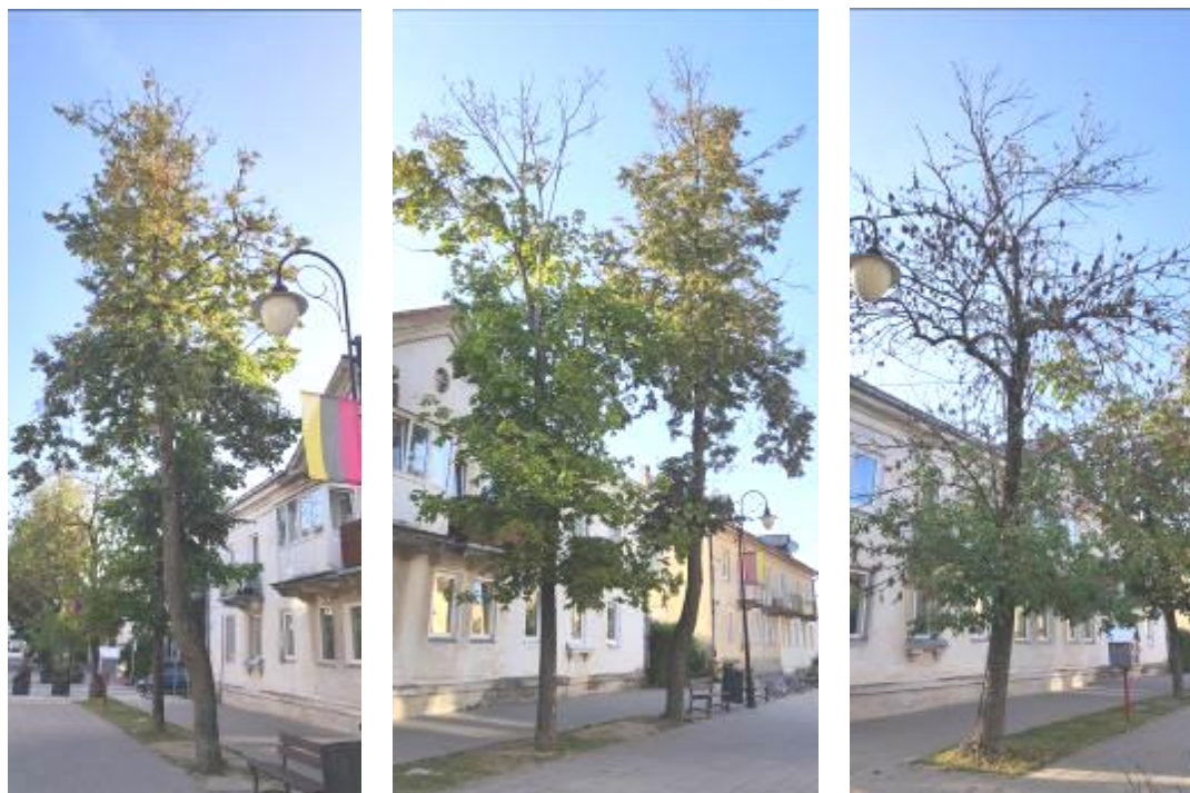
7 pav. Lentvario Bažnyčios g. želdiniai

Bažnyčios g. brandiems želdiniams didelių kamieno žaizdų ir medienos puvinio nenustatyta. Dvi sausos viršūnės ir gausėnis sausų šakų kiekis stebėtas trimis medžiams – mažalapei liepai, paprastajam klevui, paprastajam uosiui (7 pav.). Šiuos tris medžius su sausomis šakomis dėl praeivių saugumo rekomenduojama genėti.