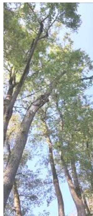
11 pav. Trakų m. Liepų alėjos kamienų pažeidimai