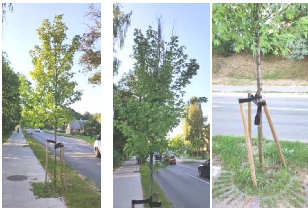
6 pav. Lentvario Klevų alėjos želdinių būklė

Klevų alėjoje pasodinti jauni sidabrinio klevo želdiniai yra geros būklės (6 pav.). Dviem medeliams stebėta džiūstanti viršūnė, vienam iš jų – sudėtingos augimo sąlygos dėl brandžios liepos stelbimo iš viršaus. Siekiant medelį išsaugoti dėl neperspektyvumo galima jį formuoti kupolu.