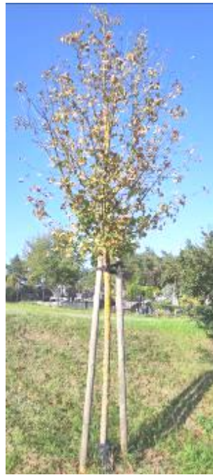
2 pav. Trakų m. Vilniaus g. trakinių klevų būklė

Trakų m. Vytauto g. želdinių būklė stebėta mažalapėms ir didžialapėms liepoms, amerikiniams ir paprastiesiems uosiams, paprastiesiems kaštonams ir kt. Defoliacija pažeidė 20% želdinių, lapų sumažėjimas nustatytas 30% medžių, lapų nekrozė – 45% (daugumai jų – lapų pakraščiuose). Šie trys rodikliai buvo 10% didesni nei 2023 m. stebėsenos duomenimis.