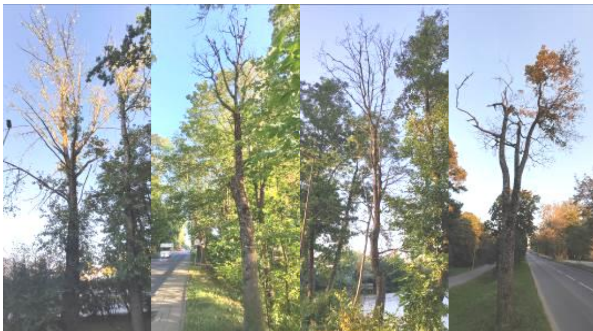
5 pav. Lentvario Klevų alėjos želdinių būklė

Klevų alėjoje pasodinti jauni sidabrinio klevo želdiniai yra geros būklės (6 pav.). Dviem medeliams stebėta džiūstanti viršūnė, vienam iš jų – sudėtingos augimo sąlygos dėl brandžios liepos stelbimo iš viršaus. Siekiant medelį išsaugoti dėl neperspektyvumo galima jį formuoti kupolu.