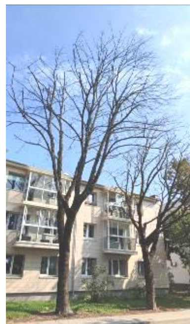
3 pav. Trakų m. Vytauto g. želdinių būklė