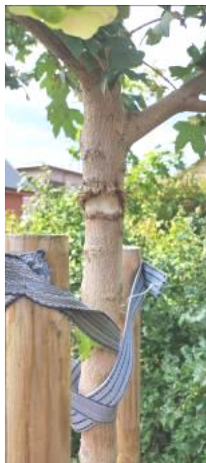
14 pav. Jaunų želdinių augimo sąlygos

Sėkmingam augalų augimui miesto želdiniuose taip pat svarbus teisingo augalų asortimento parinkimas, derinant vietinių rūšių medžius su svetimžemiais (introdukuotais) augalais (Januškevičius, Navys, 2012).