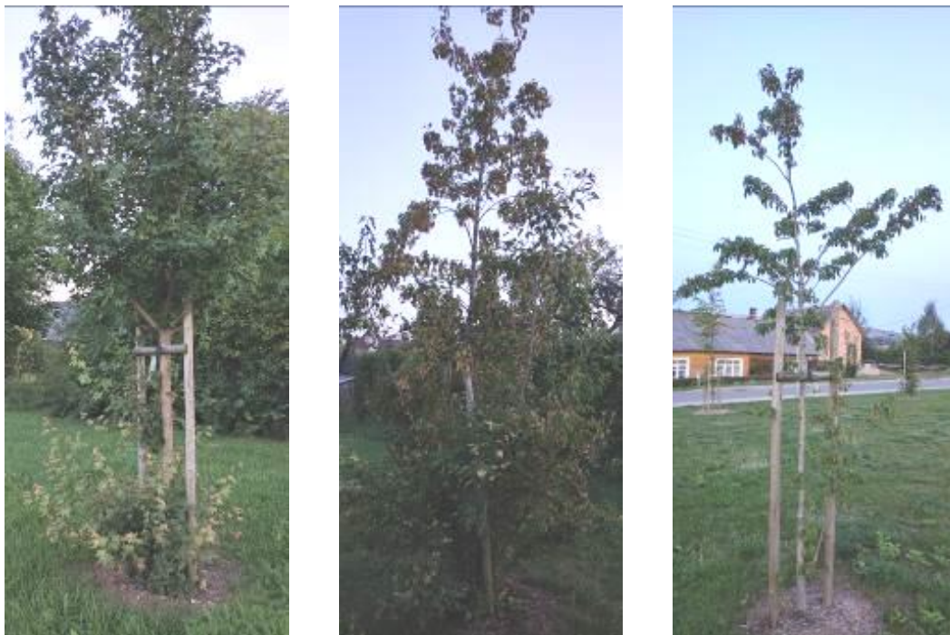
8 pav. Rūdiškių Bažnyčios g. aikštės želdinių būklė

Senuosiuose Trakuose Trakų g. augantys želdiniai geros būklės. Stipriau pažeisti du medžiai su vidutiniškai išplitusiu medienos puvinium – mažalapė liepa ir paprastasis klevas. Dygioji eglė žuvusi, nors didelio pavojaus nekelia – ją rekomenduojama šalinti.