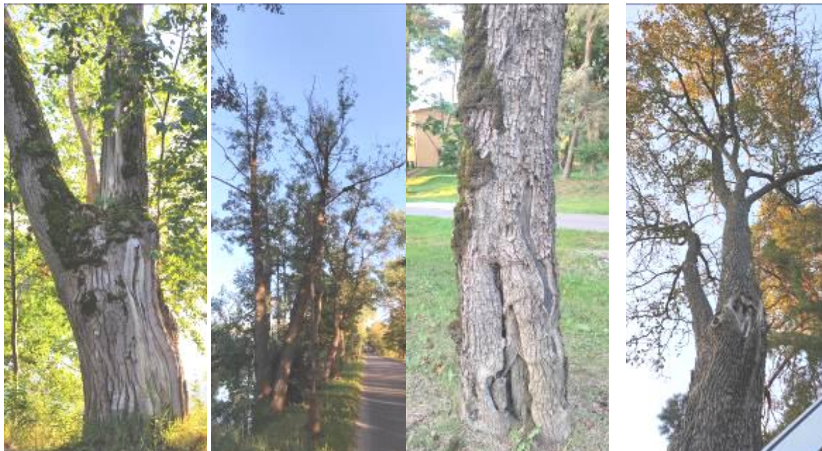
13 pav. Lentvario Klevų alėjos želdinių kamieno pažeidimai

paprastieji klevai, uosis paprastas, kanadinė ir plaukuotavaisė tuopos. Pagrindinės šių medžių šalinimo priežastys – kamieno žaizdos, medienos puviniai, sausa viršūnė. Vienas klevas ir uosis stebėsenos metu buvo nustatyti žuvę. Rekomenduojama žuvusius medžius šalinti skubiai, o pavojingos būklės medžius – šalinti kelių metų laikotarpiu.