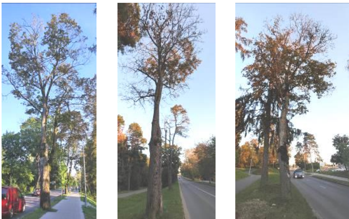
4 pav. Lentvario Klevų alėjos želdiniai

Lentvario Klevų alėjoje želdinių būklė paveikta vykusios gatvės rekonstrukcijos, kurios metu dirvožemis galimai buvo kasamas, tankinamas, galimi mechaniniai kamieno ir šaknų pažeidimai (4 pav.). Sausos šakos nustatytos 19% želdinių, defoliacija ir lapų sumažėjimas pažeidė po 9% čia stebėtų medžių. Blogos būklės medžius, kuriems redukcinis genėjimas netaikytinas, siūloma prevenciškai pašalinti atsodinant naujais jaunais želdiniais (5 pav.).