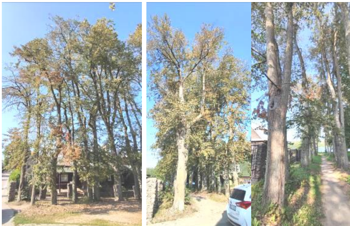
1 pav. Trakų m. liepų alėja nuo Birutės g. link Lukos ežero (kultūros paveldo objektas)

Liepų alėjoje stebėti medžiai gali būti lengvai pažeidžiami vėjo ar didesnių vėtrų – liepų kamienai liauni dėl tankaus augimo, kai kurie medžiai stelbiami dėl konkurencijos, taip pat kamieną silpnina žaizdos ir jame išplitę medienos puviniai.